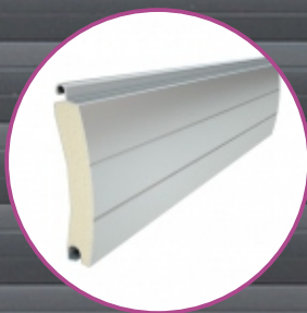
Lamele termoizolante de 77 mm