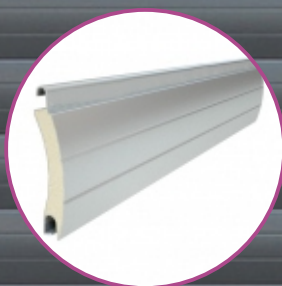
Lamele termoizolante de 55 mm